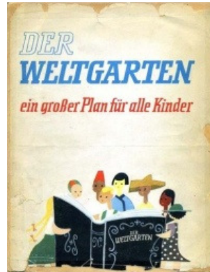
Annedore Leber (Hg.): Der Weltgarten, ein großer Plan für alle Kinder . Textgestaltung Walter May und Werner Hinz. Berlin – Frankfurt / Main, Mosaik-Verlag 1953

freier, froher und den Mitmenschen gegenüber aufgeschlossener – man kann es zumindest werden! Wir wollen es gern, und darum reisen wir!“