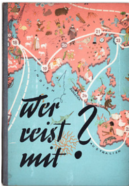
Annedore Leber (Hg.): Wer reist mit? Eine Reise um die bunte Welt . Zeichnungen von Ita Maximowna. Frankfurt / Main, Gutenberg Verlag 1950 (Copyright Mosaik-Verlag, Berlin)

Um 1950 erscheint das Jugendbuch Wer reist mit? Eine Reise um die bunte Welt . Es enthält Geschichten zu einzelnen Ländern aus allen Kontinenten und ein Würfelspiel.